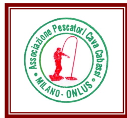
A.P.C.C. Cabassi Cabassi