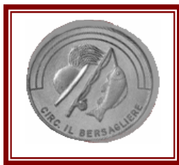
A.S.D.V. Il Bersagliere